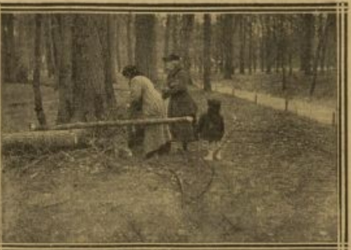
LES ARBRES ÉCROUS DU BOIS DE VINCENNES - ON CUELLE DU QUI