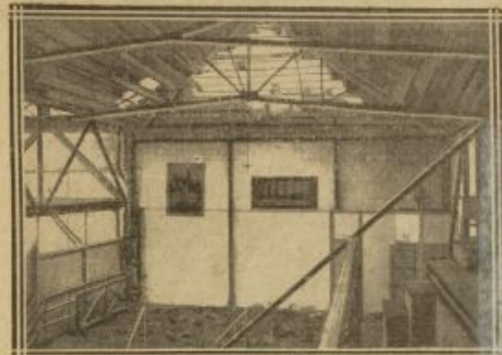
LA TOITURE DU VÉLODROME D'HIVER DÉFONCÉE PAR LE VENT