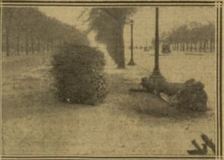
UN ARBRE DÉRACINÉ AVENUE DES CHAMPS-ÉLYSÉES