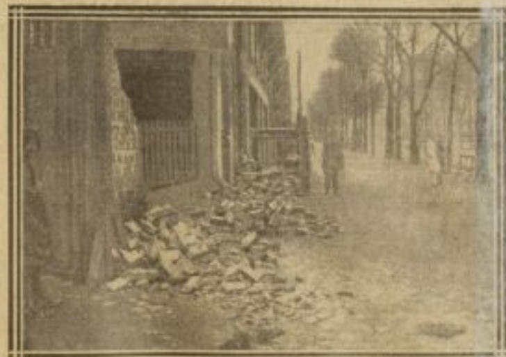
UN MUR DE BRIQUES ÉCROULÉ AVENUE DU MAINE