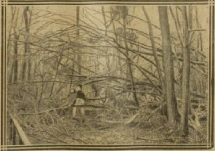
LES PAUVRES ÉBRANCHENT LES ARBRES COUCHÉS À VINCENNES

LA NACELLE DU PONT TRANSPORTEUR EST ENVAHIE PAR LES EAUX Le travail est complètement interrompu sur les quais de Rouen, du fait de la crue de la Seine. Alors que les eaux ont baissé à Paris de telle manière que la navigation a pu reprendre, la baisse que l'on escomptait ne s'est pas produite à Rouen, où la situation demeure désastreuse.