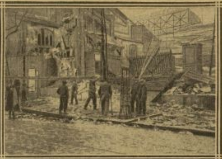
LES TRIBUNES DU STADE BERGÈRE EFFONDREES DANS LA RUE