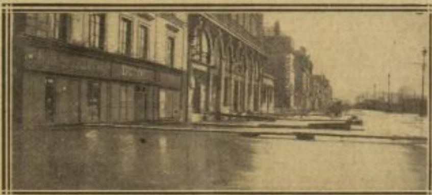
LES PASSERELLES DU QUAI GASTON-BOULET INONDÉ AUX HEURES DE MARÉE