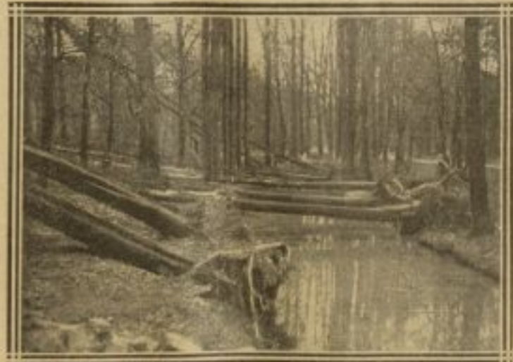
RIVIÈRE BARRÉE PAR LES ARBRES AU BOIS DE VINCENNES