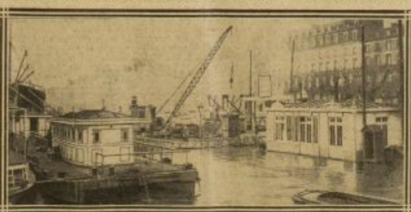
L'EMBARCADÈRE DES BATEAUX DE LA BOUILLE AU QUAI DE LA BOURSE