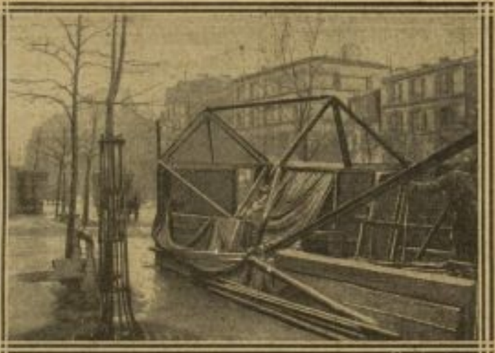
UNE BARAQUE ARRACHÉE BOULEVARD DE BELLEVILLE