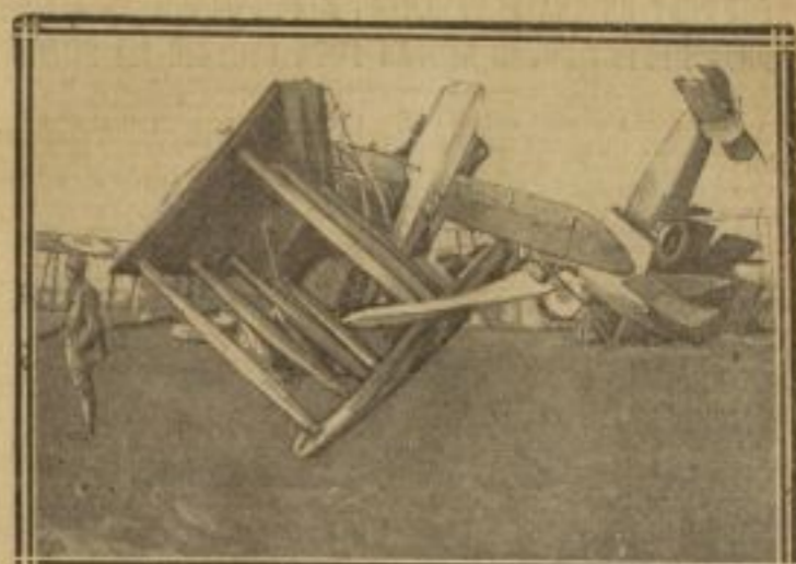
DEUX AVIONS DÉSEMPARÉS PAR LA TEMPÊTE À VILLACOUBLAY

LE PAQUEBOT "AFRIQUE" DES CHARGEURS RÉUNIS COULÉ AUX ROCHES-BONNES La tempête qui sévit sur terre et sur mer a pris les proportions d'un véritable désastre. Nous donnons ici quelques photographies significatives prises à Paris et dans les environs, ainsi que celle du paquebot "Afrique" qui, battu par les flots en furie, a donné sur une des Roches-Bonnes, au large de l'île de Ré, et a coulé. On craint qu'il n'y ait au moins 400 victimes sur 465 passagers.