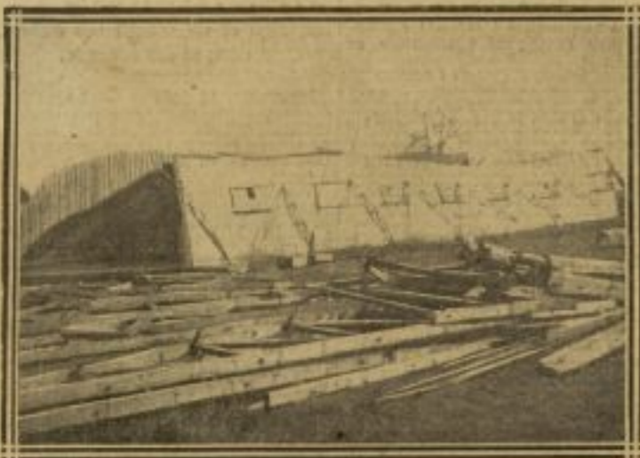
UN BESSONNEAU DÉTRUIT À L'AÉRODROME DE VILLACOUBLAY