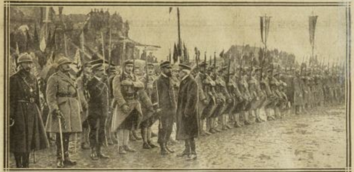
L'AMIRAL RONARC'H CAUSANT AVEC LES FUSILIERS MARINS, A DIXMUDE