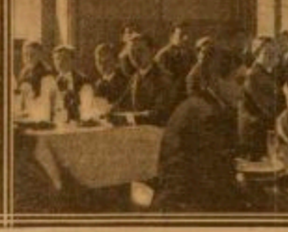
LA SAINT-CHARLEMAGNE FÊTE, HIER, A LOUIS-LE-GRAND