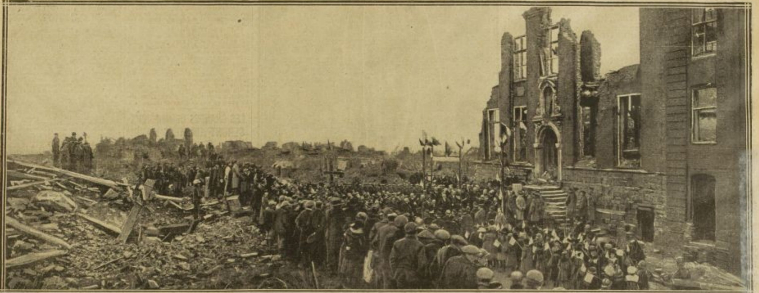
LE MAIRE DE NIEUPORT, AGÉ DE 82 ANS, PRONONCE SON ALLOCUTION DEVANT L'HOTEL DE VILLE EN RUINES DE LA CITÉ BELGE ENTIÈREMENT DÉVASTÉE