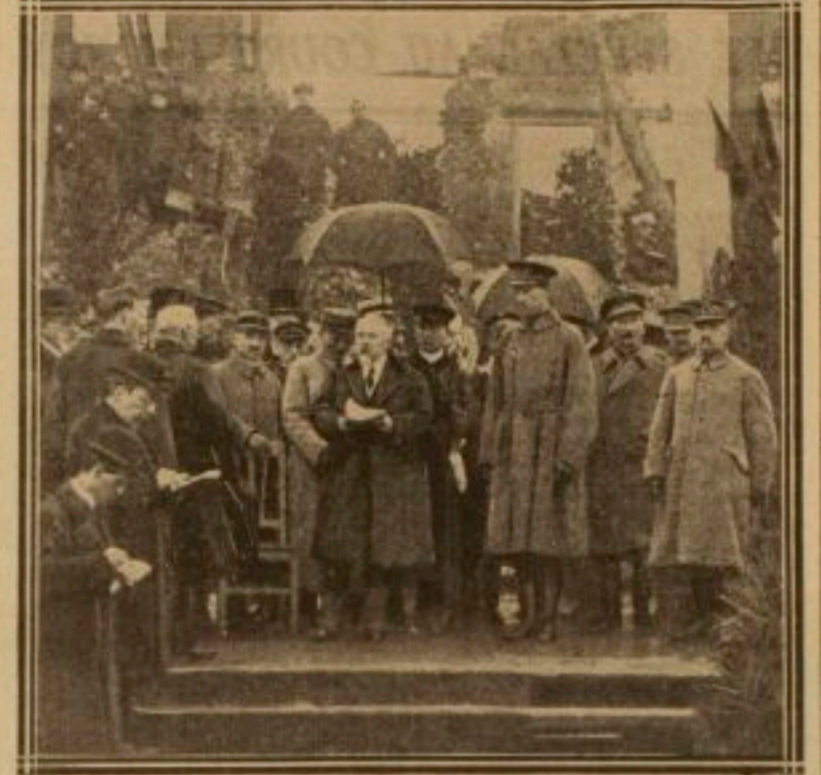
LE DISCOURS PRÉSIDENTIEL SOUS LE PARAPLUI, A DIXMUEDE