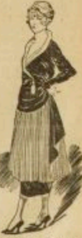
Robe d'après-midi noir et crêpe Madeline.