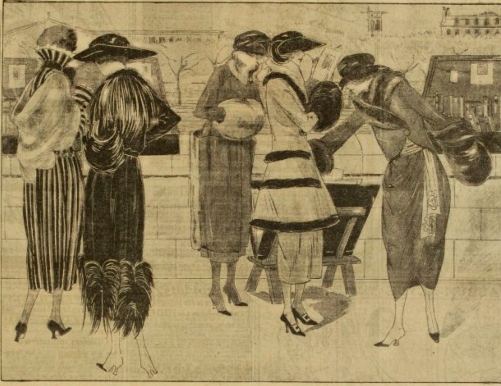
Robe de serge grise bleu et rouge. Collet de tulle. — WORME. Robe de peau de mouton gris souris et beige. — CROCEL. Tailleur de baracotta gris taupe et petit-gris. — CHAIGET. Tailleur de maille chamois garni de loutre. — JENNY. Costume de bure talus. Blouse de serge blanche. — DOUGET.